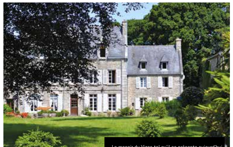
Le manoir du Vizac tel qu'il se présente aujourd'hui

le 27 août, le fils d'Henri Pitty, Michel, sous-lieutenant dans la 2 e DB du général Leclerc, est tué dans son char en entrant dans Paris. Une rue du nouveau lotissement « Les coteaux du Vizac » lui a été dédiée