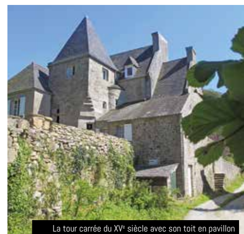
La tour carrée du XV e siècle avec son toit en pavillon renferme un magnifique escalier de pierre en colimaçon