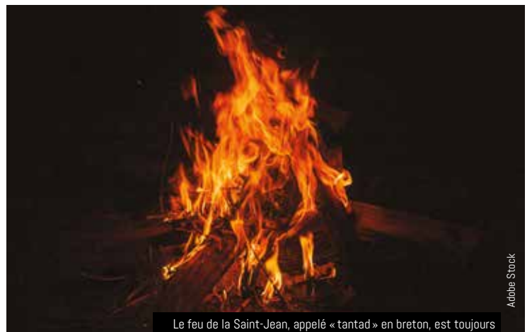
Le feu de la Saint-Jean, appelé « tantad » en breton, est toujours organisé au Douvez par le comité de quartier fief du Douvez (CQFD)

à l'initiative du comité de Kerigoualc'h, de grandes fêtes de la Saint-Jean voient le jour à Guipavas dans le secteur de Kerafur avec la venue de chanteurs, danseurs et groupes musicaux tels Alan Stivel (1971), Tri Yann (1972), Fuxan os Ventos (1973), The Dubliners (1975), etc. Cette fête populaire attire une foule de jeunes et se prolonge dans la nuit par un grand fest-noz animé, autour du feu, par les Sonerien Du. C'était un événement phare dans la vie culturelle guipavasienne de cette époque