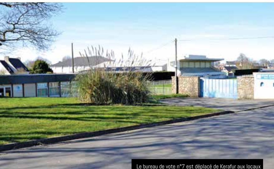
Le bureau de vote n°7 est déplacé de Kerafur aux locaux de l'ancienne bibliothèque pour tous (rue Saint-Thudon)

47 millions : c'est à peu de chose près le nombre de Français inscrits sur les listes électorales pour 2017 selon le ministère de l'intérieur. Sur Guipavas, on dénombre 10 874 inscrits.