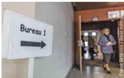
Frank Betermin / Brest métropole