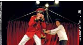
La fleur au fusil