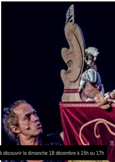
Polichinelle à découvrir le dimanche 18 décembre à 15h ou 17h

RETROUVEZ LE PROGRAMME DÉTAILLÉ DES ANIMATIONS SUR HTTP://ALIZE.MAIRIE-GUIPAVAS.FR