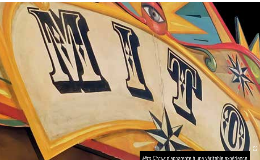
Mito Circus s'apparente à une véritable expérience cinématographique sous un petit chapiteau

Les 16, 17 et 18 décembre, la magie de Noël soufflera dans les rues et offrira à tous les habitants l'occasion d'affronter la froidure hivernale autour des traditionnels vins et chocolats chauds. Si la municipalité se charge d'apporter, dans chaque quartier, des animations, des spectacles et d'inviter le Père Noël, l'association Guip boutik organise, quant à elle, une grande tombola dans tous les commerces adhérents. La remise des lots se déroulera le 17 décembre.