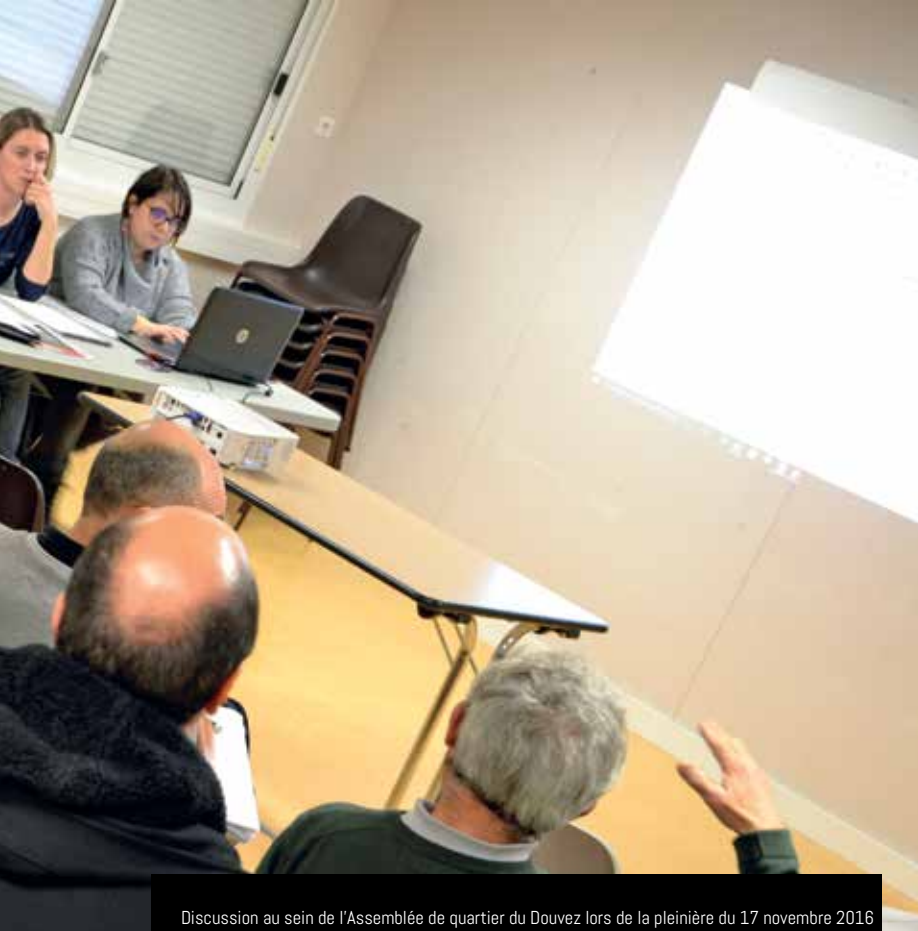
Discussion au sein de l'Assemblée de quartier du Douvez lors de la plénière du 17 novembre 2016

ou encore de sanitaires à Pen an Traon) et les travaux qu'elle a fait réaliser (réparation de la cale, nettoyage des abris bus, etc.).