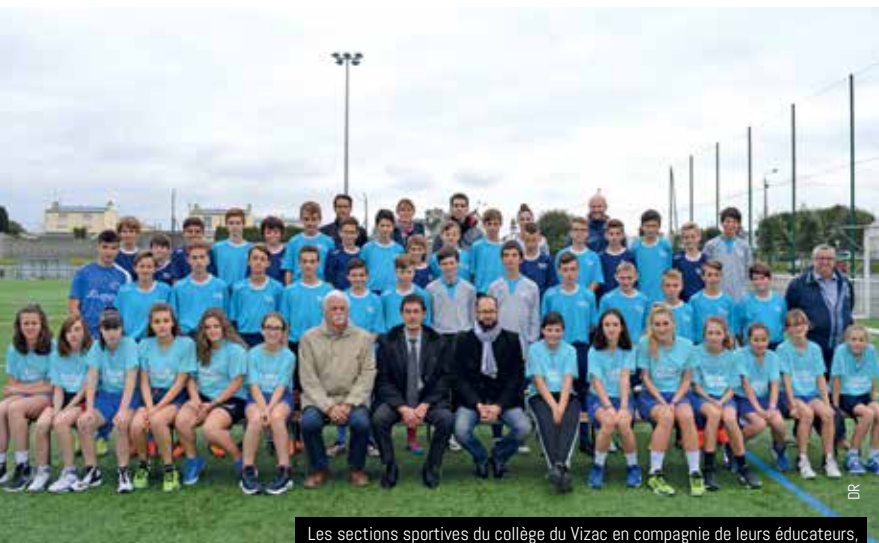
Les sections sportives du collège du Vizac en compagnie de leurs éducateurs, du principal et des partenaires (membres des Gars du Reun et élu)

« Attention, l'objectif de cette filière n'est pas le sport pour le sport », tient à ajouter Gurvan Le