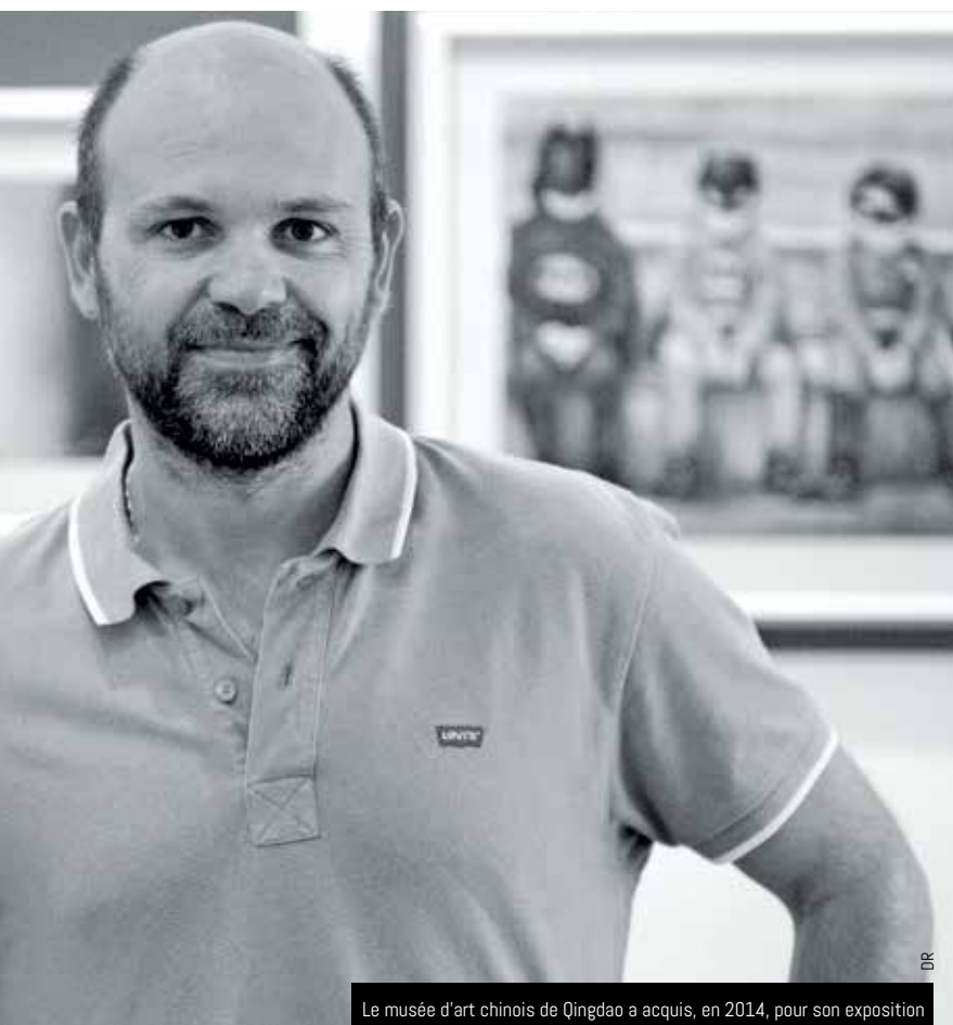
Le musée d'art chinois de Qingdao a acquis, en 2014, pour son exposition permanente d'aquarelles, deux œuvres de Pasqualino Fracasso