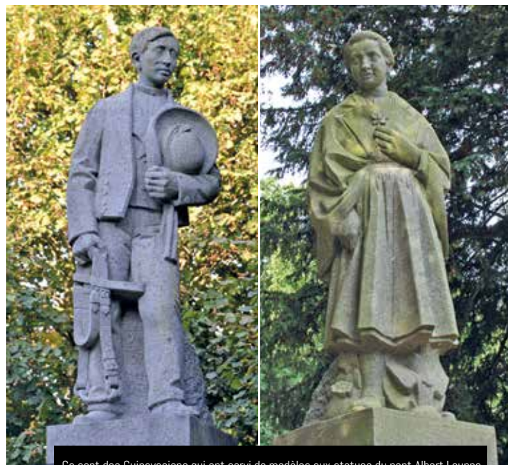
Ce sont des Guipavasiens qui ont servi de modèles aux statues du pont Albert Louppe