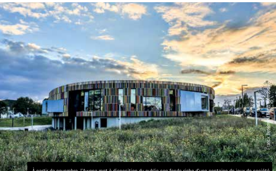
Francis Bertram / Brest métropole

À partir de novembre, l'Awena met à disposition du public son fonds riche d'une centaine de jeux de société