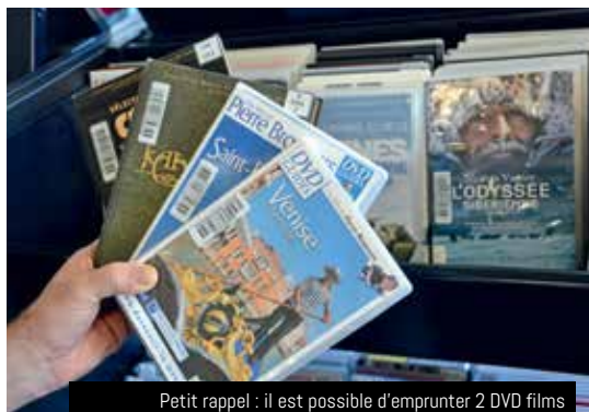
Petit rappel : il est possible d'emprunter 2 DVD films et 2 DVD documentaires (théâtre, musique, docs...) par carte