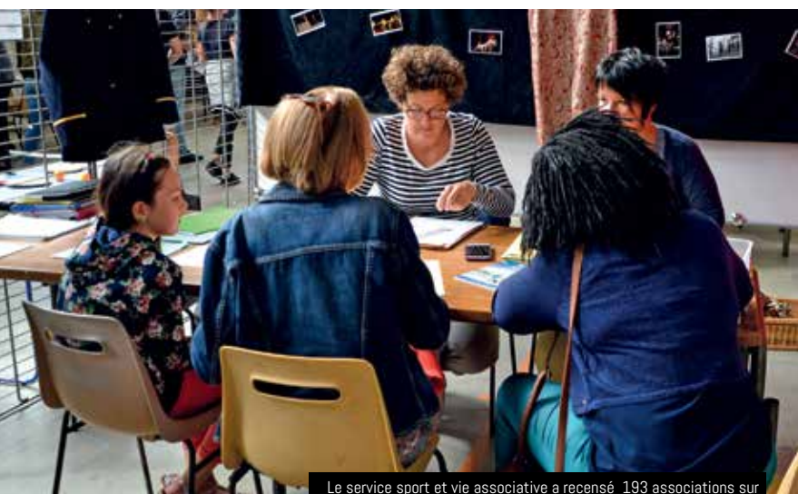
Le service sport et vie associative a recensé 193 associations sur Guipavas dont 46 sections lors de la préparation du forum