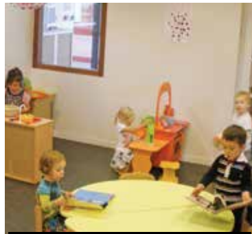
Le LAEP se situe au sein de la Maison de l'enfance dans un lieu spécifiquement aménagé