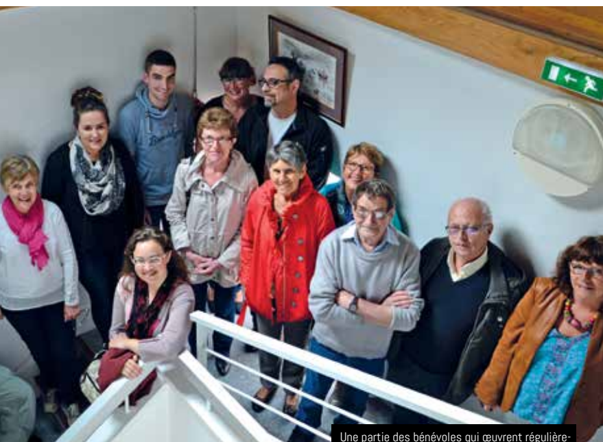
Une partie des bénévoles qui œuvrent régulièrement pour aider les enfants. Merci à eux !

Concrètement, à l'issue du goûter, les élèves (inscrits pour toute la durée de l'année scolaire) sont rejoints par deux agents communaux et l'équipe de bénévoles. Chaque groupe scolaire propose ce service à destination des enfants de la