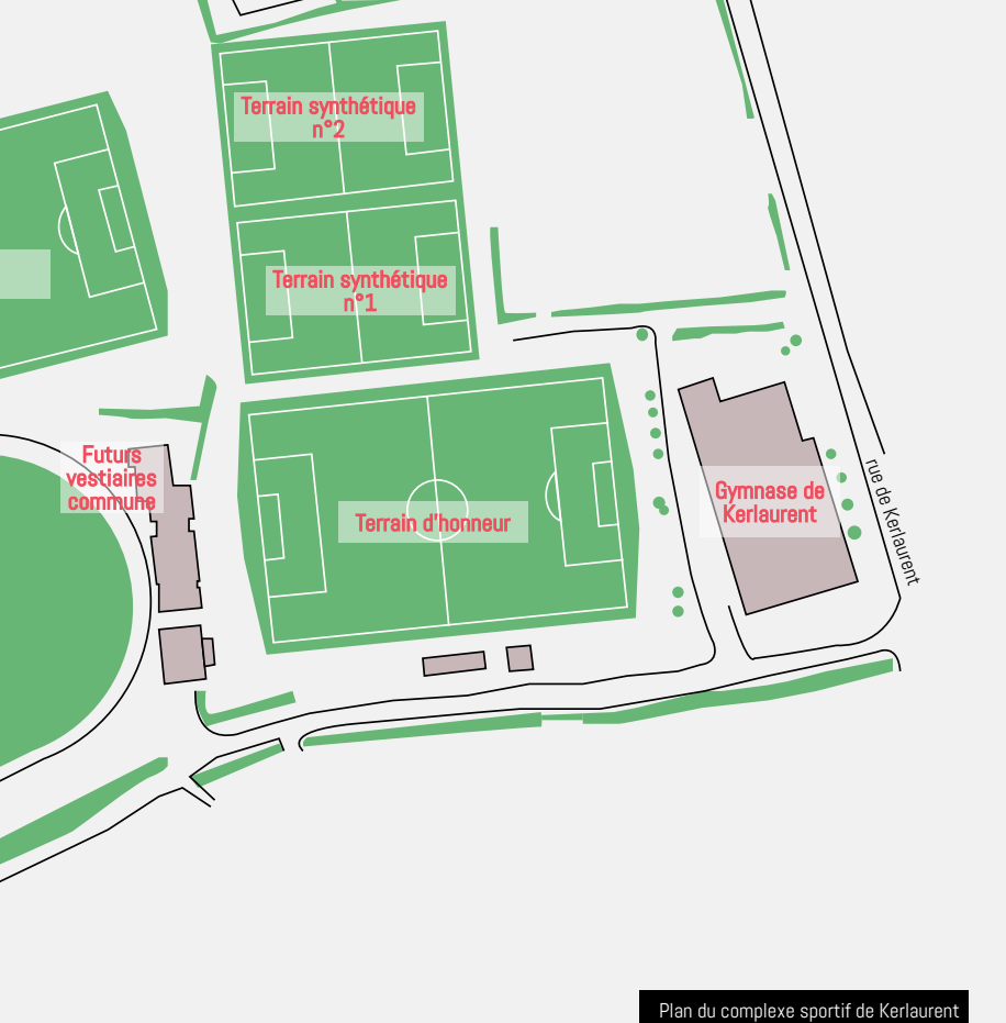
Plan du complexe sportif de Kerlaurent à l'issue des aménagements

trois terrains en herbe existants vont être repris avec des travaux de drainage, l'installation d'un arrosage et la mise en place d'une nouvelle terre végétale. Le tout sera équipé de clôtures et de pare ballons. L'un des terrains sera même réaménagé avec l'ancienne pelouse du stade Francis Le Blé. Ils seront opérationnels mi-septembre. Nul doute pour Denis Le Saint que ces nouvelles infrastructures (à Guipavas et à Pen-Helen) « vont rendre le Stade brestois plus attractif. Le club a désormais les outils pour travailler sereinement ».