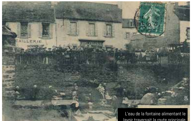
L'eau de la fontaine alimentant le lavoir traversait la route principale dans une canalisation souterraine