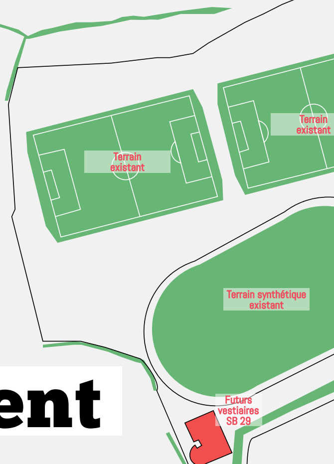
Le centre de vie du Stade brestois, hors d'eau et hors d'air, début août