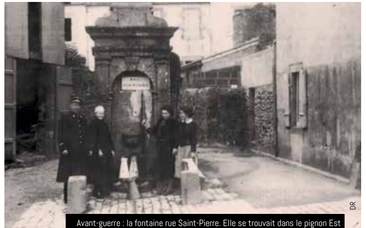
Avant-guerre : la fontaine rue Saint-Pierre. Elle se trouvait dans le pignon Est de l'actuelle boulangerie Bléas. La source existe toujours sous le salon de thé

le secteur de la fontaine est détruit par les bombardements allemands