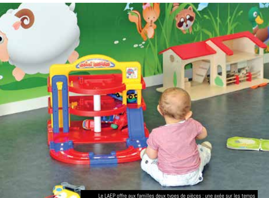
Le LAEP offre aux familles deux types de pièces : une axée sur les temps calmes pour les plus petits et une autre permettant aux enfants de bouger

Le lieu d'accueil enfants parents (LAEP) de Guipavas est un espace gratuit et anonyme de soutien, de rencontres et d'échanges à destination des (futurs) parents. Héritier des « maisons vertes », chères à Françoise Dolto, le LAEP offre l'opportunité aux adultes de discuter pendant que leurs enfants y rencontrent de nouveaux amis.