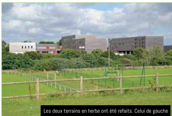
Les deux terrains en herbe ont été refaits. Celui de gauche bénéficie de l'ancienne pelouse du stade Francis Le Blé

De son côté, la ville va apporter la dernière touche aux aménagements, prévus de longue date sur le complexe, avec la réalisation d'un vestiaire (400 m 2 ) et d'un club house (135 m 2 ) à destination de l'ALC. Cet équipement est situé entre le terrain synthétique et le terrain d'honneur. Ces ultimes travaux qui contribueront à l'amélioration et à la valorisation du site seront entamés dans le courant du dernier trimestre 2016. La livraison est prévue pour l'été 2017. ■