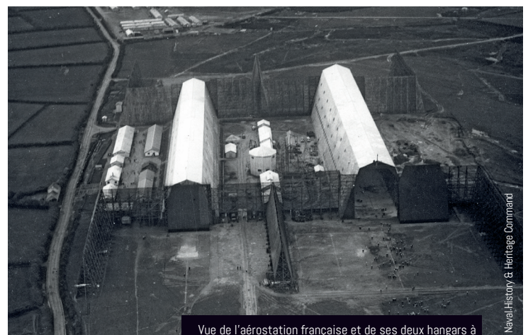
Vue de l'aérostation française et de ses deux hangars à dirigeables sur le site de l'actuel aéroport en 1918

grande activité dans les aérostations américaine et française de Guipavas dans la perspective de la venue à Brest, le 13 décembre, du président des États-Unis Woodrow Wilson