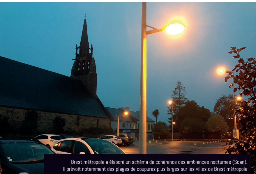
Brest métropole a élaboré un schéma de cohérence des ambiances nocturnes (Scan). Il prévoit notamment des plages de coupures plus larges sur les villes de Brest métropole afin de maîtriser les coûts énergétiques tout en maintenant la qualité de l'éclairage public

Les services municipaux s'inscrivent également dans cette charte en faveur du climat, en réfléchissant ce mois-ci aux enjeux climatiques autour d'une fresque du climat. Un forfait mobilité durable (30 agents concernés), instauré en janvier 2022, incite à covoiturer ou à se déplacer à vélo. Le télétravail a été déployé au sein de la collectivité et des réflexions sont menées sur la gestion des déchets, à la fois en interne et en direction des habitants lors des manifestations culturelles et sportives. Sur ces questions, nous tous, pouvons agir ! ■