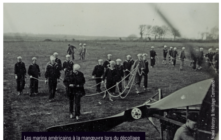
Les marins américains à la manœuvre lors du décollage d'un dirigeable sur la base de Guipavas