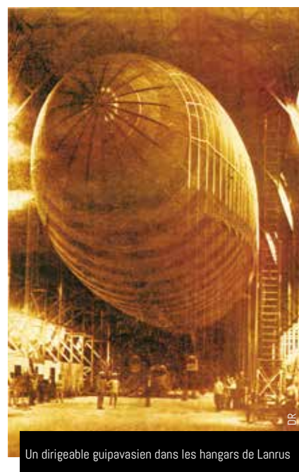
Un dirigeable guipavasien dans les hangars de Lanrus

avant de quitter Lanrus, les Américains organisèrent une fête « au camp ». C'est là que les Guipavasiens ont vu leur premier film américain