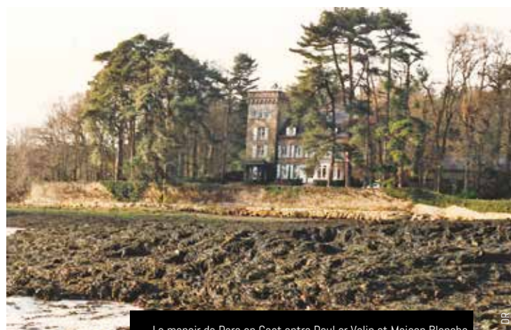
Le manoir de Parc an Coat entre Poul ar Velin et Maison Blanche